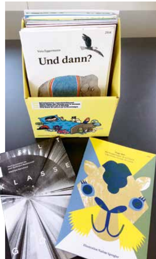
■ Über 2500 Titel sind bis heute im SJW erschienen, jährlich werden 170 000 Hefte verkauft.

Wie alle Verlage, geht die Digitalisierung auch an SJW nicht spurlos vorbei. Der Vertrieb der Hefte über