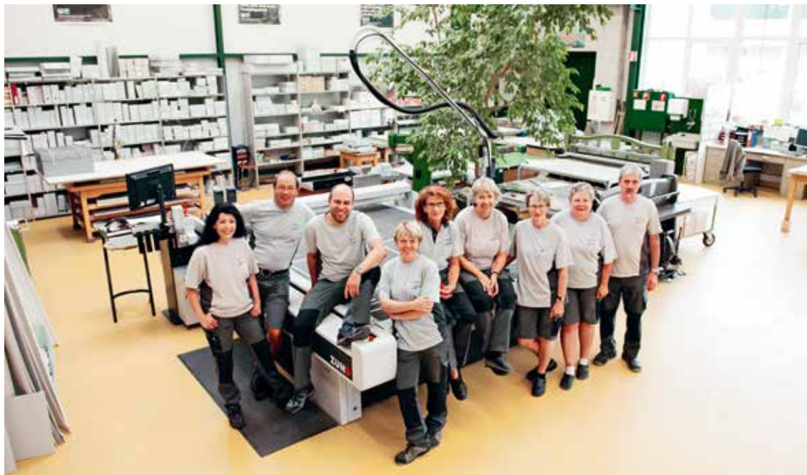
■ Das Produktionsteam in Spiez stellt Archivierungssysteme unter anderem für die Uno, das Rote Kreuz und die WTO her.

Die Firma aus Spiez bietet Archivierungssysteme nach Mass