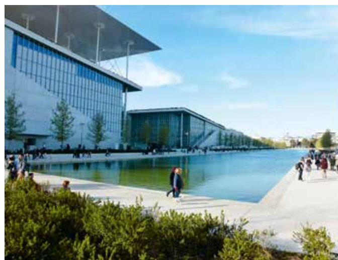
■ Wächst von rechts hinten fast in den Himmel: Das Stavros Niarchos Foundation Center mit der griechischen Nationalbibliothek (Bildmitte) und der Nationaloper links am Bildrand.

In Athen haben die Nationalbibliothek und die Nationaloper ein gemeinsames neues Haus erhalten. Es hat 670 Mio. Euro gekostet, ist das grösste Bauvorhaben in Griechenland seit den Bauten für die Olympischen Spiele 2004 und wurde vom italienischen Architekten Renzo Piano entworfen, der auch für das Zentrum Paul Klee in Bern verantwortlich zeichnet, wo dieses Jahr die MV der SAB/CLP stattfand (siehe Seiten 22–25). In Athen und Bern wachsen beide Gebäude aus dem Gelände heraus und präsentieren auf ihrem «Rücken» Natur – in Bern eine jährlich anders bepflanzte Wiese, in Athen eine riesige Parkanlage. Finanziert hat die griechische Variante die Stiftung des Readers Stavros Niarchos, der 1996 in Zürich verstorben ist. Der Komplex im Vorort Kallithea verewigt ihn mit dem Namen Stavros Niarchos Foundation Center. Sie hat das Bauwerk dem griechischen Staat geschenkt – zusammen mit dem Versprechen, den Betrieb von Haus und Park mit jährlich 10 Mio. Euro zu unterstützen. (Halo)