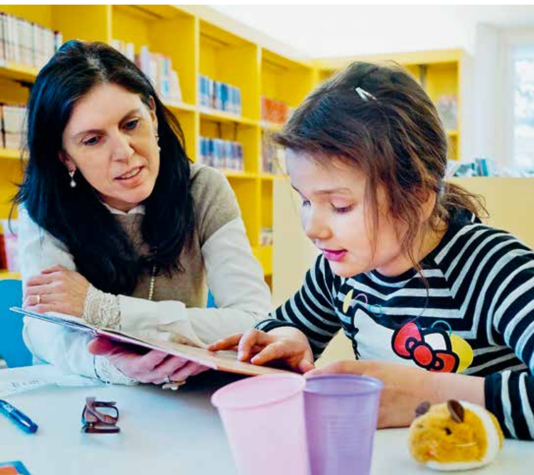
■ Eine Erwachsene und ein Kind bilden ein sogenanntes Lesetandem, hier in der Stadtbibliothek Aarau.

aber auch mit Aufrufen in den Medien wurden Mentoren gesucht. Zahlreiche Personen unterschiedlichen Alters haben sich gemeldet: Familienfrauen, pensionierte Lehrer, eine junge Musiklehrerin, eine Betriebswirtin oder eine pensionierte Finanzfachfrau, um nur einige Beispiele zu nennen. In kurzen «Bewerbungsgesprächen» erhielten die Kandidatinnen und Kandidaten die nötigen Erstinformationen und konnten ihre Eignung unter Beweis stellen. In der Zwischenzeit sind die Mentoren, speziell in Zofingen, zu richtigen Bibliotheksbotschaftern geworden, mit vielen weiteren Querverbindungen zur Stadtbibliothek. Ein toller Nebeneffekt! In einem dreitägigen Kurs erhielten die zukünftigen Mentoren diverse Inputs, um ihre Aufgabe fantasievoll und entspannt anzupacken. Die Kinder wurden in Zusammenarbeit mit den Schulen auf das