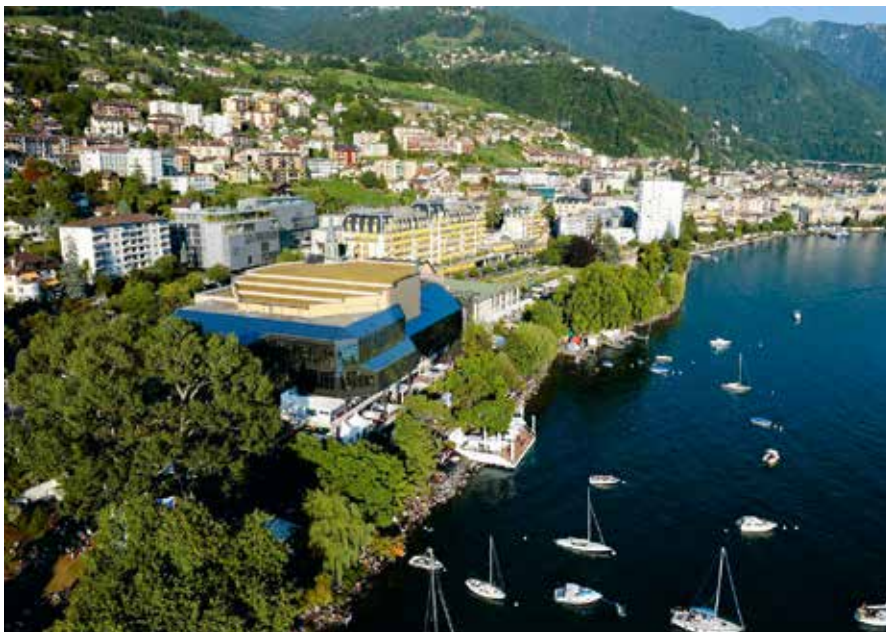
■ Der Kongress findet im Montreux Music & Convention Centre statt.

Qui dit congrès des bibliothèques suisses dit lac. Après Lausanne en 2010, Constance en 2012, Lugano en 2014 et Lucerne en 2016, c'est Montreux qui accueillera l'événement en 2018. Située sur les rives du lac Léman, cette ville pleine de charme est connue dans le monde entier pour son festival annuel de jazz. Du 29 août au 1er septembre 2018, ce seront toutefois des bibliothécaires, des exposants et des hôtes qui investiront le Miles Davis Hall. Les préparatifs vont d'ores et déjà bon train pour que ce congrès soit une source d'inspiration et propose un programme varié, conçu pour tous les types de bibliothèques. Bloquez déjà la date dans votre agenda ! Cet automne, les exposants recevront des documents qui les renseigneront sur les possibilités en matière de stands et de publicité. (kru)