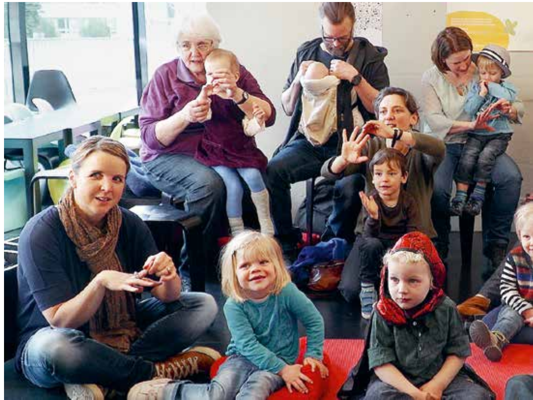
■ «Buchstart» in der Pestalozzi-Bibliothek Sihl City, Zürich.

Gerade Bibliotheken nutzen diese Chance gern. Bibliotheksteams setzen sich, angeleitet durch und begleitet von Leseanimatorinnen, mit den noch ungewohnten Fragen rund um die jüngsten Bibliothekskunden auseinander. Geradezu forciert wurde diese Entwicklung 2008 durch die Lancierung von «Buchstart», der für die Bibliotheken eine grosse Herausforderung darstellt. Für